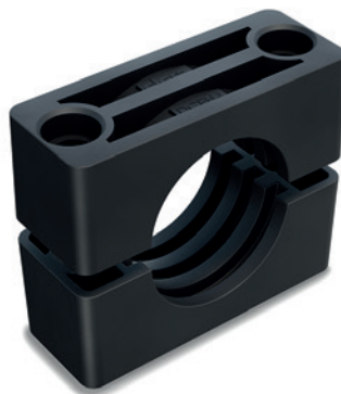
Correspondencias entre el grupo DIN 3015-2 y el grupo DCE-H.